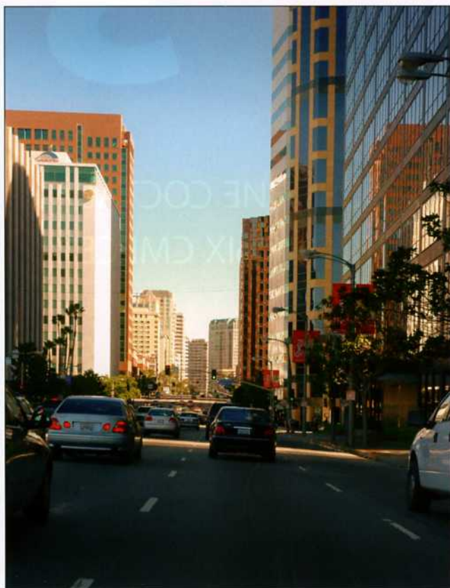
Хорошая видимость разметки покрытия — одно из важнейших требований его эксплуатационного состояния.