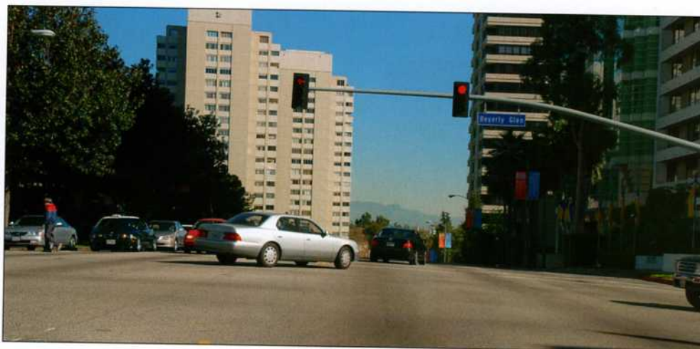
Хорошую видимость в продольном профиле не всегда удастся обеспечить в большом городе даже для относительно недавней застройки.

Оценивая метод Хаббарда-Филда с позиций сегодняшнего дня, целесообразно отметить следующее. Испытание косвенно характеризует предельное сопротивление сдвигу материала в момент его разрушения при однократном нагружении. Это предельное сопротивление отражает влияние как удельного сцепления «с», так и угла внутреннего трения «φ», которые входят в закон Ш. Кулона для предельного касательного напряжения \tau_{max} = \sigma \cdot \tan \varphi + c , при достижении которого возникает необратимое пластическое течение идеального упругопластического материала. Предполагается, что если под действием приложенной нагрузки в самой опасной в отношении сдвига точке покрытия появляются нормальное напряжение «σ» и касательное напряжение «τ», которое меньше предельного «τ max », то необратимый сдвиг не произойдет, то есть считается, что в этом случае после проезда автомобиля якобы нет остаточной деформации.