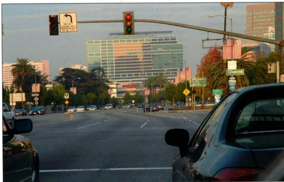
Перекресток улиц Wilshire и Sepulveda в Лос-Анджелесе находится в первой десятке по количеству ДТП в стране. Число ДТП в прошлом году снизилось после дополнительной разметки и установки телекамер, фиксирующих проезд на поздний желтый — красный сигнал светофора.